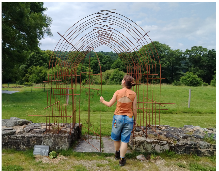
Porte des morts réalisée lors de la résidence 2025