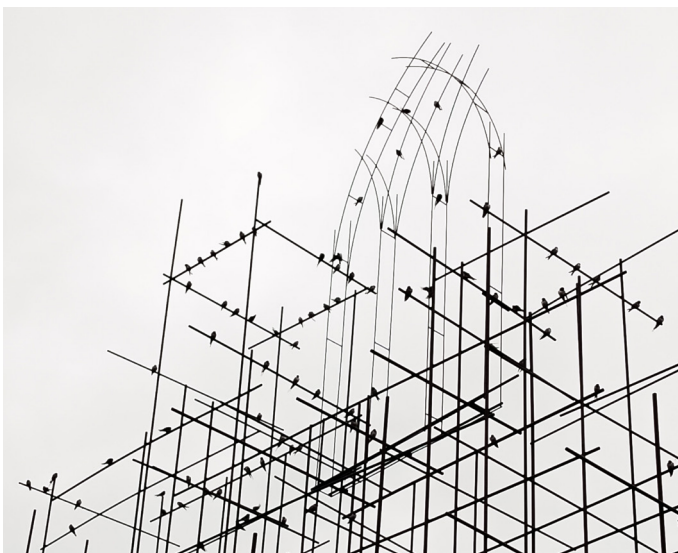
Vue sur Élévation réalisée lors de la résidence 2025