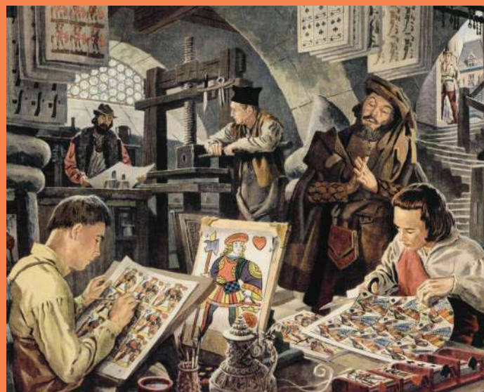
Atelier de maître cartier

Véritable marqueur de notre histoire, la forme et le graphisme des cartes ont évolué selon les mœurs, les évolutions sociales et les techniques de fabrication.