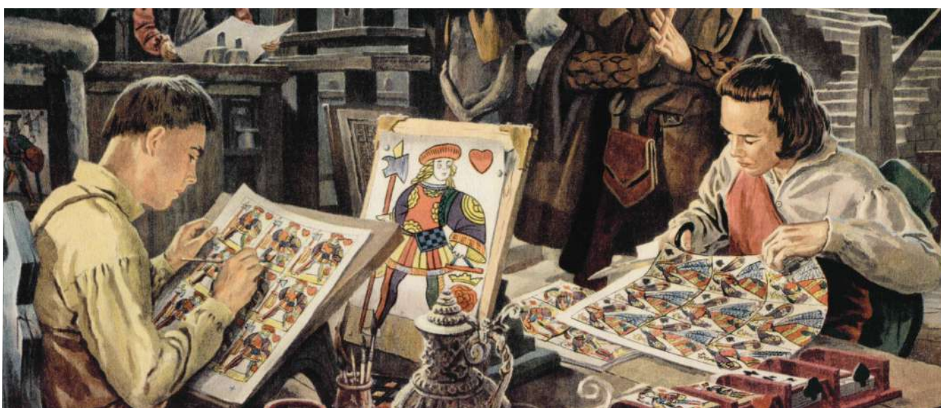
Atelier de maître cartier

C'est toute une histoire les cartes à jouer !